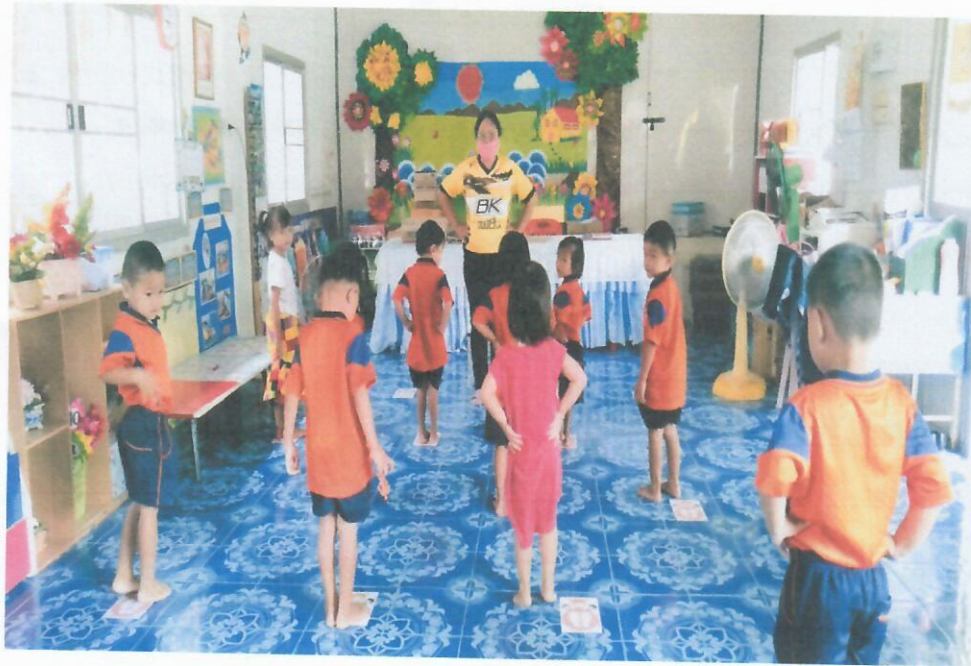
ออกกำลังกายและส่งเสริมสุขภาพอนามัยของนักเรียน